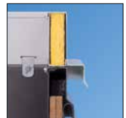
Sobre marcos de escotillas de techo existentes