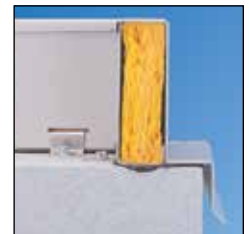
Marcos de hormigón contruidos in situ