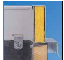
Marcos de madera contruidos in situ